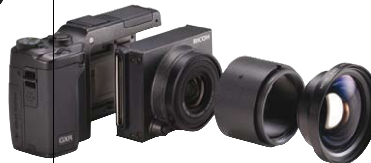
GXR / Japan / DFA Grand Award 2012