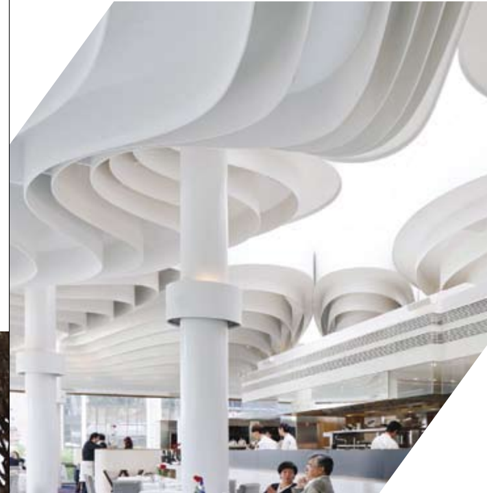
Pacific Place / Hong Kong / DFA Grand Award 2012