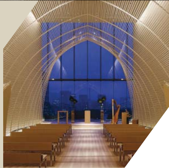
Palace Hotel Tokyo Chapel / Japan / DFA Grand Award 2012

The judging panel will have the right to determine the number of award, and the right not to name a winner for any of them. 심사위원단은 각 수상분야에서 우승자의 개수를 정할 수 있는 권한이 있습니다. 심사위원단은 적절한 작품이 없을 경우 우승자를 선정하지 않을 권리가 있습니다.