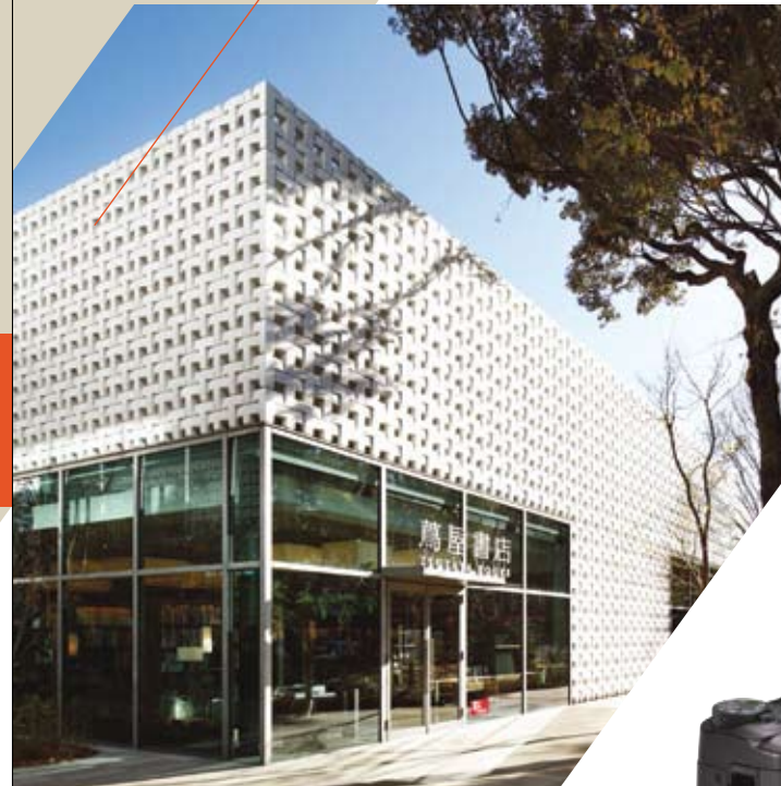
Daikanyama T-Site / Japan / DFA Grand Award 2012