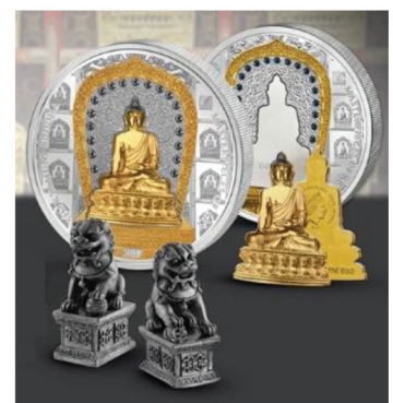
결합형 금 · 은화