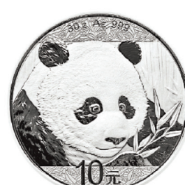
중국 판다 은화 앞면