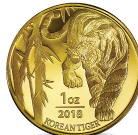
호랑이 불리온 메달 앞면