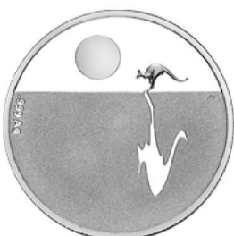
호주 캥거루 은화 앞면