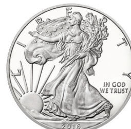
미국 이글 은화 앞면