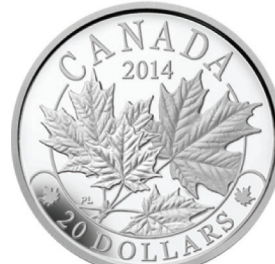
캐나다 메이플 은화 앞면