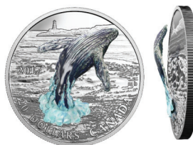
필름 부착형 은화