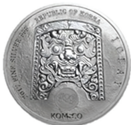
2017 치우천왕 메달 공통앞면