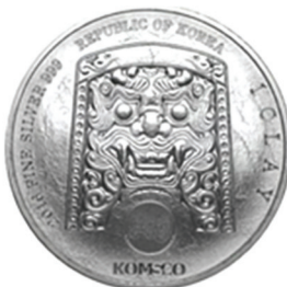
2016 치우천왕 메달 공통앞면