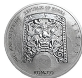
2017 치우천왕 지신 메달 공통앞면