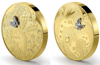
다이아몬드 삽입 금화