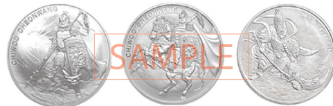
시리즈 제품화 가능

❻ 제품에 대한 상세한 설명과 제작 방법 등 부가적인 내용을 자유롭게 기술합니다. (내용이 많을 경우 별도 양식 추가 가능)