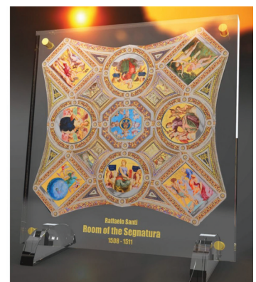
결합형 색채 은화