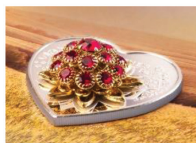
루비 부착 은화