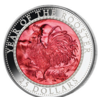
자개 부착 은화